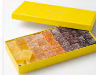
COFFRET 36 PÂTES DE FRUITS