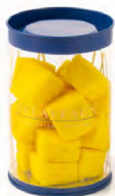
GUIMAUVE FRUIT DE LA PASSION