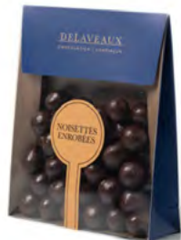
NOISETTES CHOCOLAT NOIR OU AU LAIT