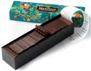
COFFRET 40 CARRÉS NOIR GRAND CRU

Offrez-vous un voyage intense au cœur des origines du cacao avec cet assortiment de 40 carrés de chocolat noir Grand Cru, soigneusement sélectionné.