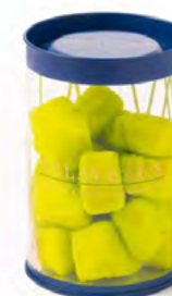
GUIMAUVE CITRON VERT