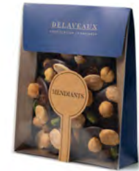
MENDIANTS CHOCOLAT NOIR