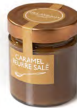
CARMEL BEURRE SALÉ