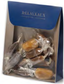
ASSORTIMENT DE CAMELS