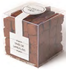
PAVÉ DE LAMORLAYE