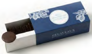
PALETS DÉGUSTATION DU CHEF