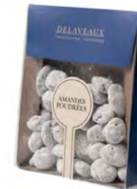
AMANDES SUCRE GLACE