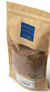
POUDRE À CHOCOLAT CHAUD