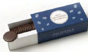
PALETS DÉGUSTATION CAFÉ