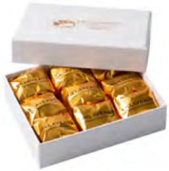
COFFRET MARRONS GLACÉS