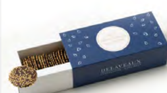
PALETS DÉGUSTATION AU SÉSAME