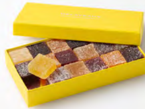
COFFRET 18 PÂTES DE FRUITS