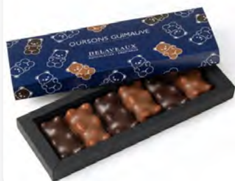
COFFRET 6 OURSONS GUIMAUVE