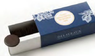
PALETS DÉGUSTATION VENEZUELA