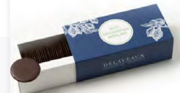
PALETS DÉGUSTATION BRÉSIL