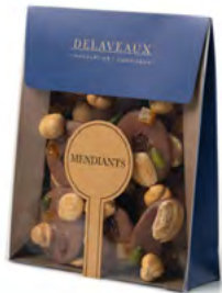
MENDIANTS CHOCOLAT AU LAIT