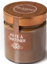
PÂTE À TARTINER