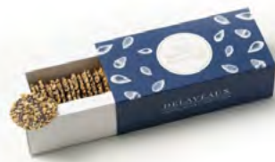
PALETS DÉGUSTATION AMANDES