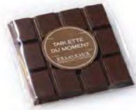
TABLETTE DU MOMENT

Offrez-vous un voyage intense au cœur des origines du cacao avec cet assortiment de 40 carrés de chocolat noir Grand Cru, soigneusement sélectionné.