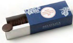
PALETS DÉGUSTATION MADAGASCAR